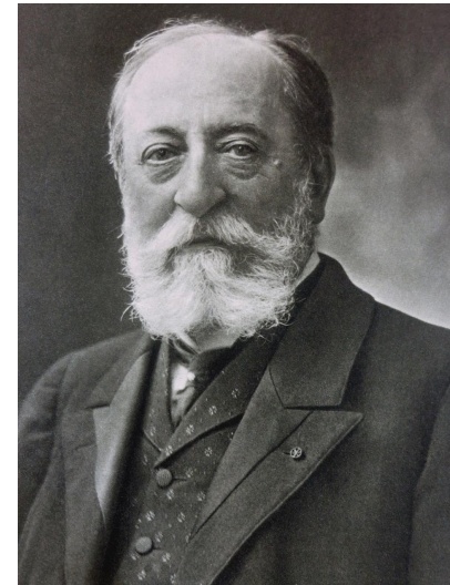
C. C. Saint-Saëns